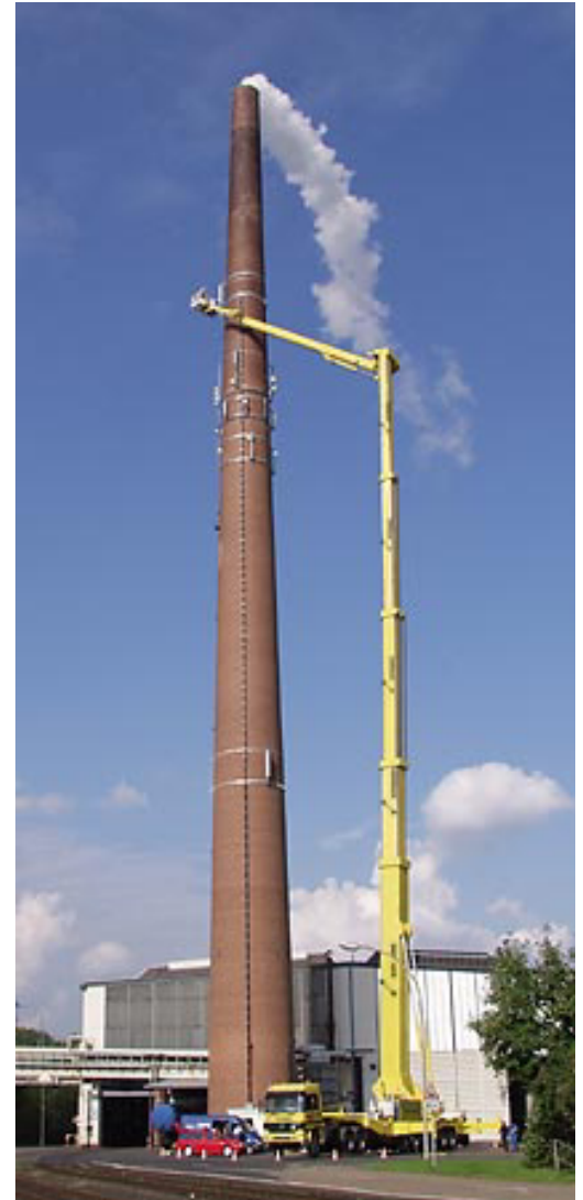
Ruthmann STEIGER® im Einsatz

Mit der FE-Analyse konnten die analytischen Nachweisverfahren für mehrere Lastfälle abgesichert und Geometrievarianten untersucht werden.